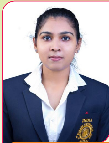
GARISHMA B.Com. Gold Medal In Senior National Fencing Championship