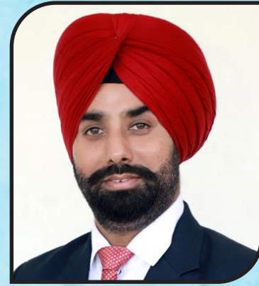
S.S. CHATHA Chairman Fateh Group of Institutions

Our education system is presently going through considerably critical time. All the world, of course, has become almost a village. The revolution in the Information Technology has actually transformed all the traditional modes of Imparting education. Modern students are baffled by the infinite of the limitless Choices. Everything, whether useful or useless, is readily available on the Internet. Consequently, the attention of students often gets diverted away from studies and There precious time is lost in or spent on futile and unproductive contents easily accessible to them on the mobile phones.